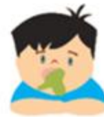
Kurang selera makan, rasa loya, dan muntah