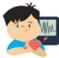
Degupan jantung yang laju