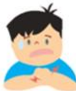
Kesemutan atau kebas